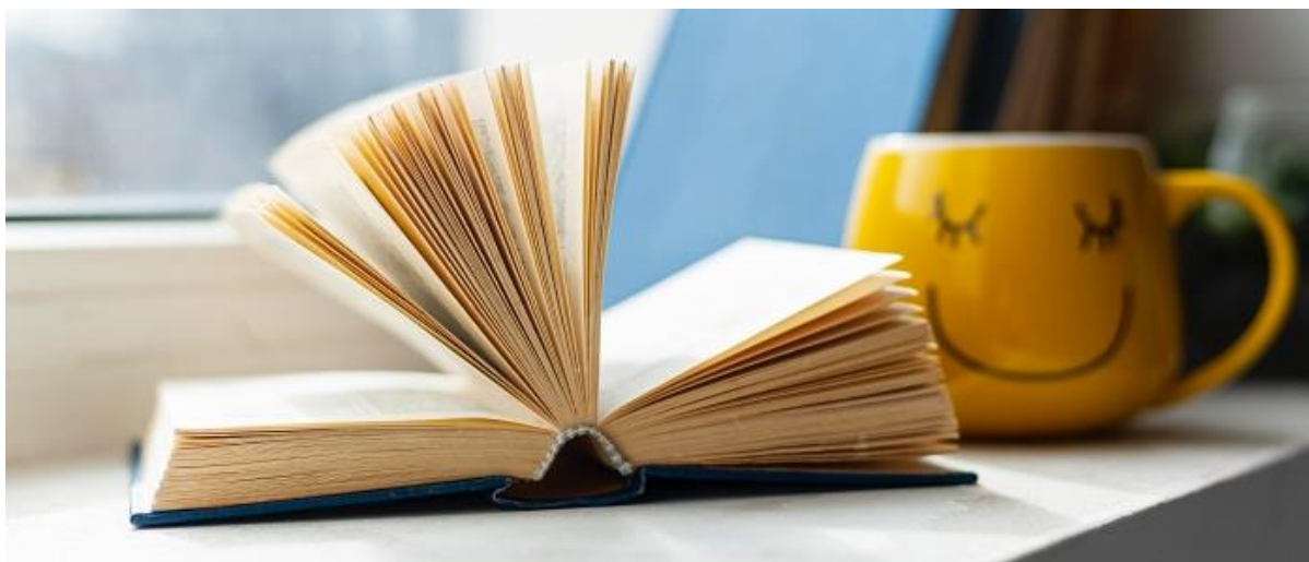
Cr.บริษัท บุ๊คพลัส พับลิชชิง จำกัด (22 กุมภาพันธ์ 2566)

ก็อย่างที่กล่าวมาข้างต้น ถึงแม้จะเป็นยุค Digital Era ก็ยังปฏิเสธไม่ได้ว่า ตำราหรือหนังสือที่ตีพิมพ์ในรูปแบบรูปเล่ม ก็เป็นยังมีความสำคัญควบคู่ขนานไปกับสภาพสังคมที่เปลี่ยนไป เพื่อแสดงเจตจำนงและประสบการณ์ของผู้เขียนที่ฝากไว้ให้ได้ศึกษา ทั้งนี้เพื่อให้ผู้ศึกษาได้ค้นพบเส้นทางและหลักหนีกำแพงของเครือข่ายสังคมออนไลน์ในปัจจุบัน