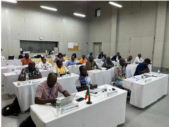
ห้องประชุมปาล์มอินพหลิม