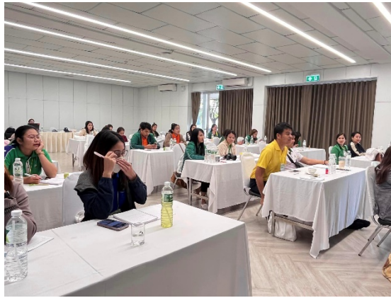
ห้องประชุมตาลกิ่ง