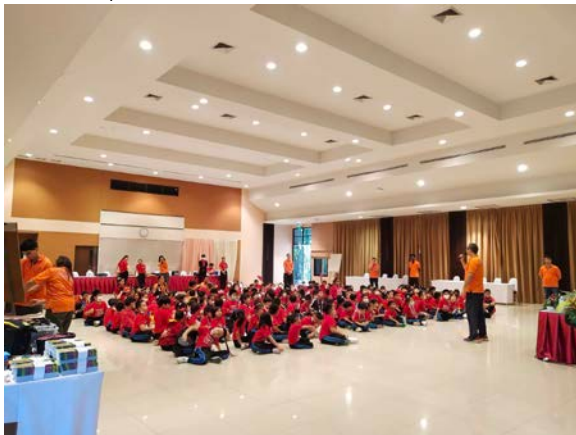
ห้องประชุมหงส์เหิร