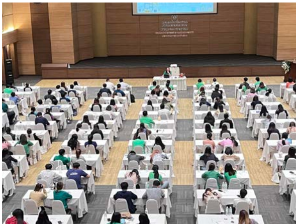
แสนปาล์ม คอนเวนชัน ฮอลล์