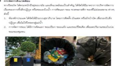
6. การจัดการสิ่งแวดล้อม